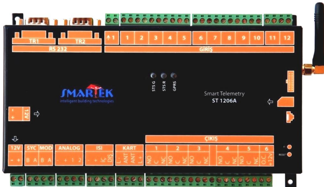
Şekil 1: Smart Telemetry ST-G1206A